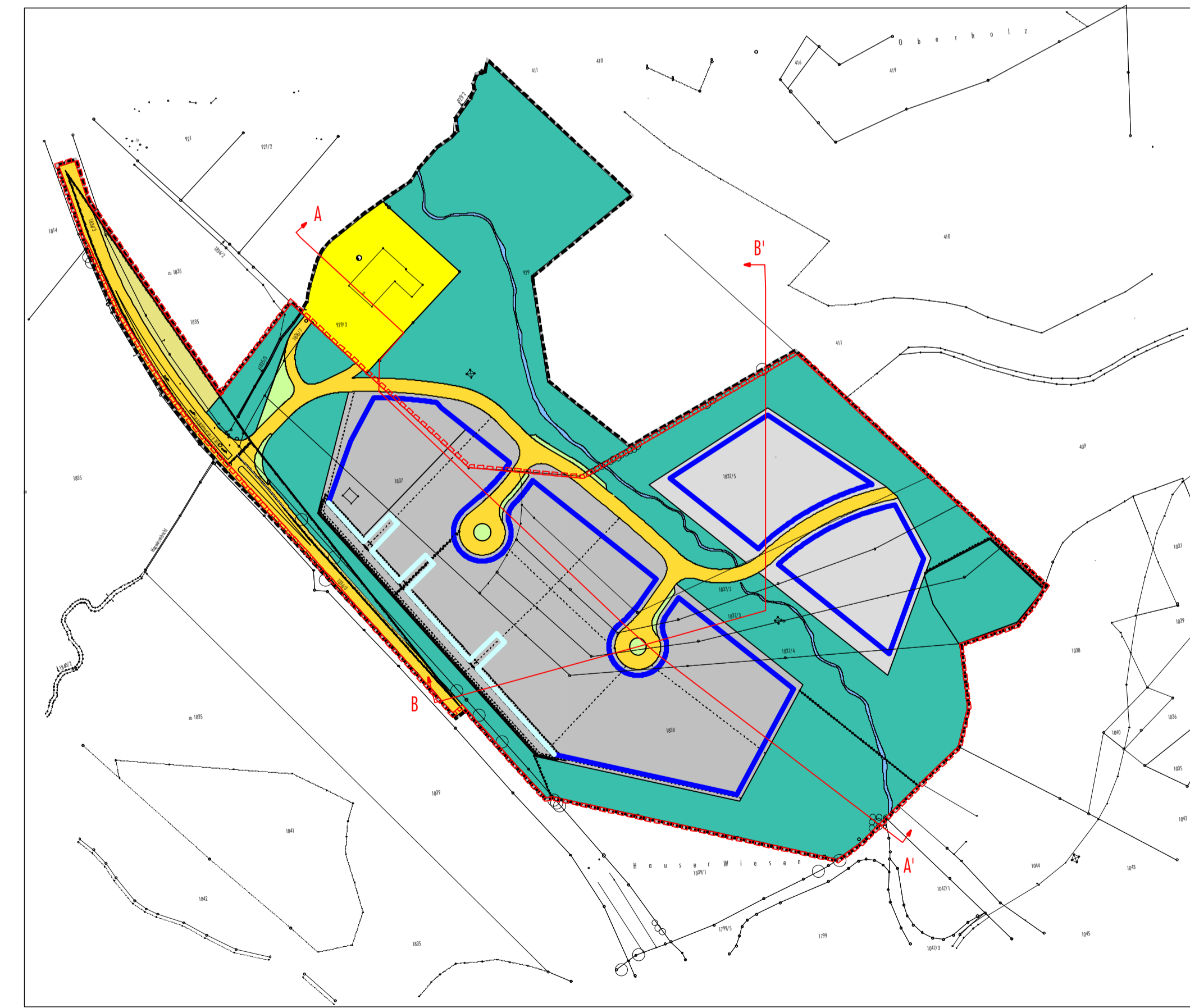
Schnittlagen M 1: 2.500